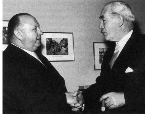
Heinrich Hellwege und Hinrich Wilhelm Kopf (1957)

Auch die Parteienlandschaft kam nach dem Zweiten Weltkrieg in Bewegung, wovon vor allem das bürgerliche Spektrum betroffen war. Die CDU als überkonfessionelle Sammlungspartei führte zur Verdrängung der namentlich im Oldenburger Land starken Zentrumspartei. Auch die deutsch-hannoversche Bewegung, der Heinrich Hellwege entstammte und die sich 1945 als Niedersächsische Landespartei (NLP) gründete und 1947 in DP umbenannte, hatte in der neuen Union eine beträchtliche Konkurrenz. Und nicht zuletzt besaß Heinrich Hellwege in SPD-Ministerpräsident Hinrich Wilhelm Kopf, dem „roten Welfen“, auch eine charismatische Führungspersönlichkeit als Gegner im Kampf um das Amt des Regierungschefs.