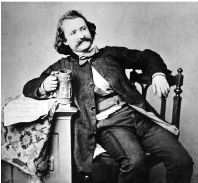
Wilhelm Busch, 1860.

Alles schien im Lot. Doch dann wurde das Haus vor einem Jahrzehnt umgebaut, die Dauerausstellung mit den Werken von Wilhelm Busch deutlich verkleinert und die meisten seiner Zeichnungen, Bildergeschichten und Gemälde in das Magazin verbannt, wo sie seitdem vor sich hindämmern. An ihre Stelle traten zunächst beachtenswerte Sonderausstellungen, die anfangs noch häufig im Kontext zu den Werken von Wilhelm Busch standen. Doch auch das ließ nach und ist seit langem Vergangenheit! In letzter Zeit musste man sich zusehends wundern,