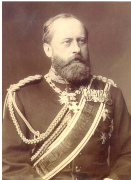
Graf Otto zu Stolberg-Wernigerode