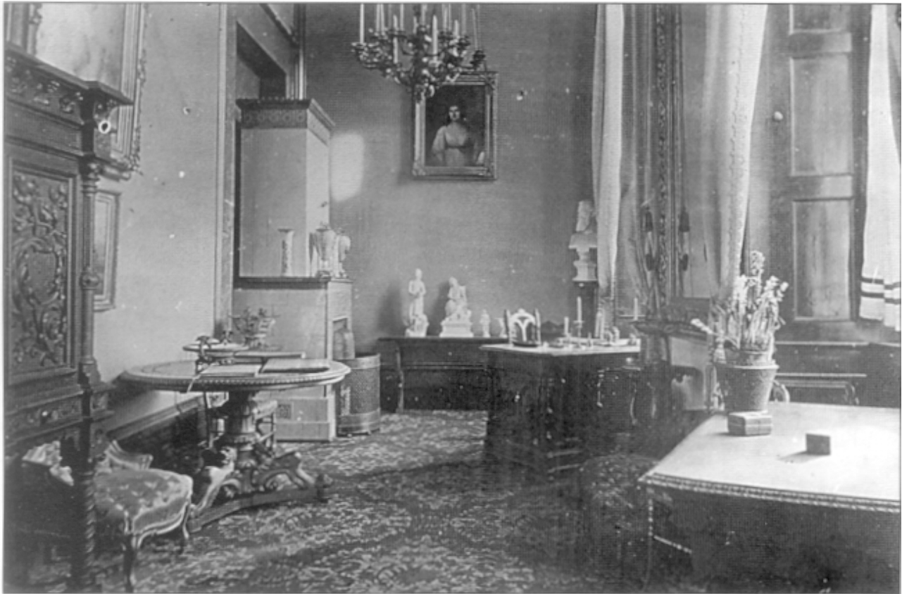
Arbeitszimmer des Grafen Otto zu Stolberg-Wernigerode

Nachdem der Provinzialfonds, der der Provinz jährlich 500.000 Taler für eigene Belange aus dem Staatshaushalt garantierte, bewilligt war, übernahm v. Bennigsen das Amt des Landesdirektors. Gemeinsam mit ihm konnte der Freikonservative v. Stolberg in der Folgezeit sein Provinzialverwaltungsmodell durchsetzen.