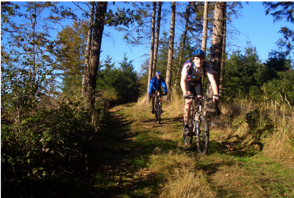
Mountainbiker im Mittelgebirge

Der Lebensraum Wald, der besonders für den Naturpark Solling-Vogler eine hervorgehobene Rolle spielt, wird dem Besucher im Waldmuseum und Erlebniswald in Schönhagen näher gebracht. Von der Geschichte bis hin zum ökologischen Gefüge im Wald wird der für Fauna und Flora existenzielle Naturraum in Ausstellungen und in Natura als Erlebnispädagogik vorgestellt. In Uslar befindet sich auch das erste Baumhaus-Hotel Niedersachsens, das seinen Gästen verschiedene Varianten des alten Jugendtraums näher bringt – Wohnen unter den Baumwipfeln in luftiger Höhe. Zum Wohlfühlen, Entspannen und Sporttreiben bietet der Naturpark Solling-Vogler auch viele Angebote. Alpinsportlern bietet der Naturpark weitläufige Wanderwege durch Wiesentäler, Hochebenen und schroffe Felsen. Besonders für jung gebliebene Sportler bietet das Mittelgebirge einen optimalen Raum, um Natur und Sport in Einklang zu bringen. Mit dem Mountainbike lassen sich 760 Kilometer und 17.000 Höhenmeter in verschiedenen Kursen erkunden. Einzelstrecken zwischen 22 und 60 Kilometer lassen für Familien und Sportler alle Wege offen. Nicht ohne Grund gilt das Mittelgebirge als Paradies für Radsportler, die sogar einmal im Jahr ein eigenes Mountainbike-Rennen haben.