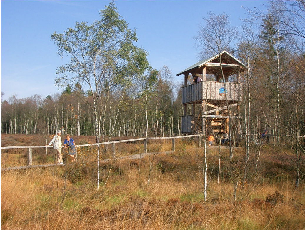
Naturbeobachtung und Entspannung

Der Naturpark Solling-Vogler bietet für jung und alt, Sportler oder Entspannungssuchenden, Naturliebhaber oder kulturell interessierten Besucher vielfältige Möglichkeiten.