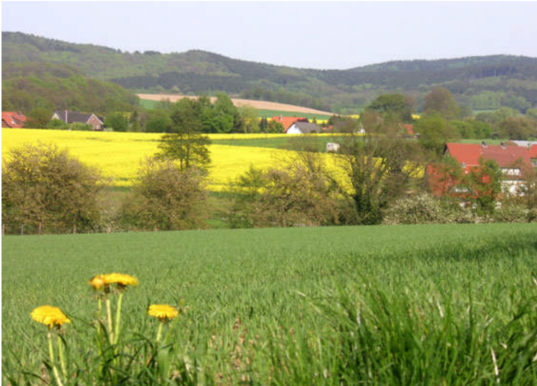
Typische Parklandschaft am Teutoburger Wald